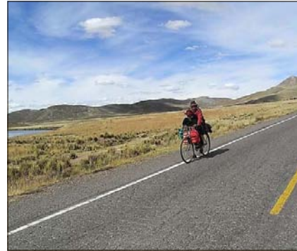
Luzerner Paar radelt von Istanbul nach Singapur